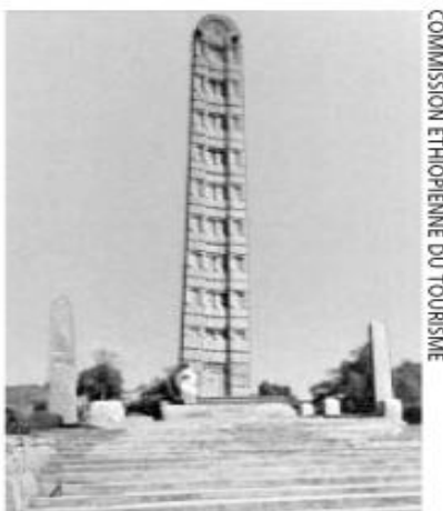
L'Obelisque éthiopien pillé par les envahisseurs Italiens est rendu aux propriétaires, aux autochtones.

5.2.1. La restitution de vestiges et objets historiques pillés par des colons ou des envahisseurs est l'une des voies de restauration, de réhabilitation socio-économique et culturelle.