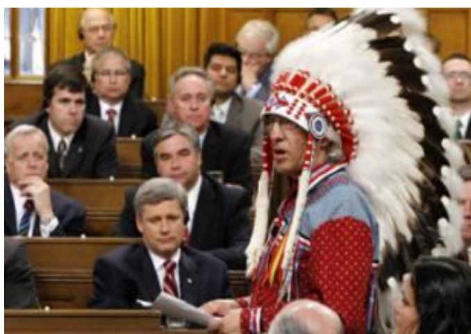
Phil Fontaine, membre d'une communauté autochtone, s'exprime devant le parlement Canadien au nom de tous les autochtones.

5.3.2. Le mercredi 11 juin 2008, c'était le tour du premier ministre canadien de présenter, devant le Parlement, des excuses sincères du gouvernement canadien et de demander "le pardon" des peuples indigènes : 1.300.000 Indiens, Métis et Inuits (640 communautés différentes), soit 3,8 % de la population canadienne (de 33 millions). Ces excuses marquent l'aboutissement d'un long processus de réhabilitation des communautés autochtones, la reconnaissance du « génocide culturel » et un mea culpa sur les « pensionnats autochtones ». Créés à la fin du 19 ème siècle, ces établissements spécialisés, tenus par des églises chrétiennes, ont enrôlé de force 150 000 enfants indigènes pour les « civiliser », leur faire « oublier » leur langue et leur culture. De nombreux enfants y ont été soumis à des abus physiques et mentaux. La dernière de ces écoles n'a été fermée qu'en 1996. Selon Phil Fontaine, Chef de l'Assemblée des premières nations, qui a passé dix ans dans un de ces pensionnats, « c'est le chapitre le plus sombre de notre histoire. À défaut de pouvoir tuer tous les Indiens, ils ont décidé de tuer l'Indien dans l'enfant », a-t-il déclaré.