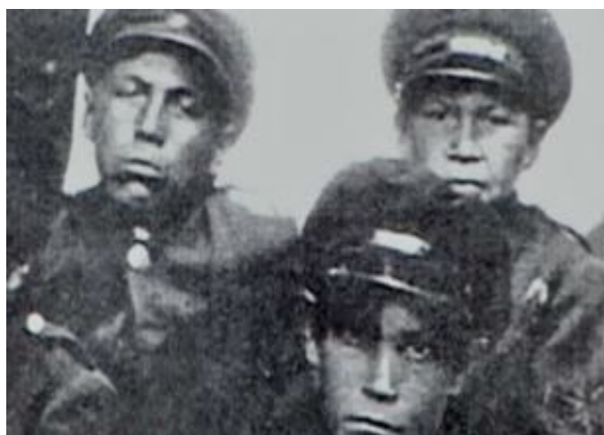
Au Canada, des patriarches et martyrs de la liberté des peuples autochtones sont maintenant honorés