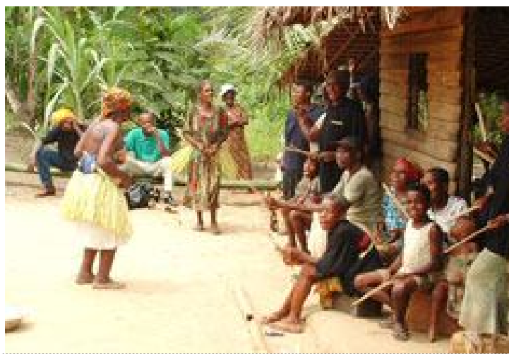
Des activités psychosociales des pygmées (via leur tradition) entrain d'être promues et encouragées au Cameroun

5.2.2. Accompagnement à la sédentarisation et prise en charge de peuples indigènes, aborigènes ou autochtones (exemple de la restauration culturelle des pygmées au Cameroun et leur prise en charge socioéconomique).