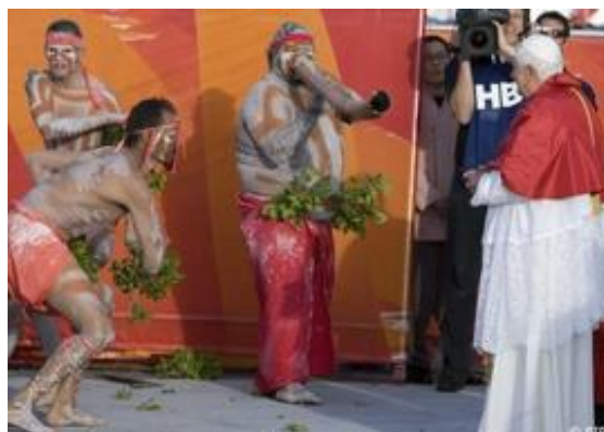
1 er semestre 2008, le Pape Beno  dicte XVI rend visite aux autochtones de l'Australie et f  licite le gouvernement pour la pr  sentation des excuses (voir aussi la photo en page de garde).

5.3.1. Le 12 février 2008, le chef du gouvernement australien présentait ses excuses au aborigènes, au nom de l'Australie, pour les injustices subies pendant deux siècles. Le discours historique, prononcé au Parlement et retransmis en direct sur les grandes chaînes de télévision nationales, dénonçait l'atteinte à la dignité et l'humiliation dont ont été victimes les premiers habitants du pays. La communauté aborigène comprend 455.000 personnes et représente 2% de la population australienne.