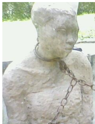
Monument d'esclave enchaînée à Zanzibar

5.1.2. La création de sites mémoriels, tel que le marché des esclaves de Zanzibar, est un acquis. L'aménagement ce site émouvant de la traite négrière est une initiative tout à fait légitime. Le site informe sur un affairisme jadis fait au su et au vu d'un peuple autochtone impuissant, administré sous une tyrannie colonialiste.